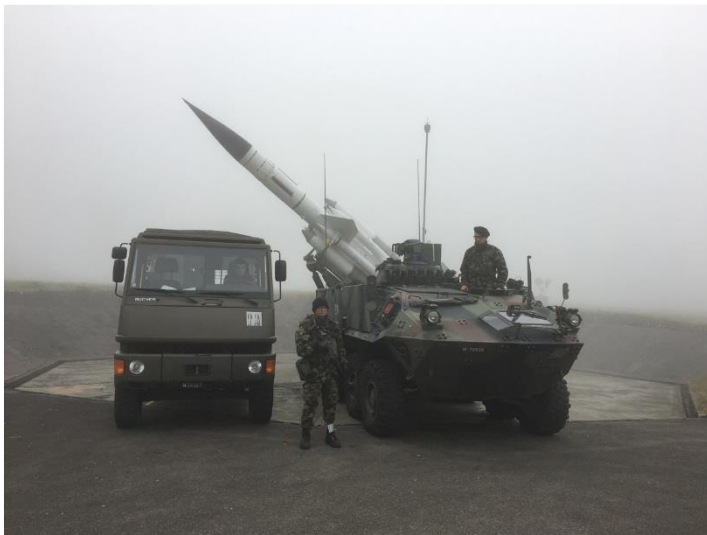
Armee gestern und heute auf dem Gubel

Am 17. Juni 2016 fand eine kombinierte Besichtigung im Flieger und Flab Museum Dübendorf und anschliessend auf dem Gubel statt, organisiert von der Schweizerischen Gesellschaft für militärhistorische Studienreisen (GMS) unter der Leitung von Oberst aD Ruedi Wicki. Über 40 Damen und Herren erlebten einen höchst interessanten Tag zu den Themen M Flab (Dübendorf) und BL-64 (Gubel). Nachdem in der Folge am 31. Oktober 2016 die Führercrew des FF Museums Dübendorf auf unserer BL-64-Anlage zu Besuch war, haben wir gemeinsam beschlossen, den Ausbau solcher kombinierter Führungen näher zu prüfen.