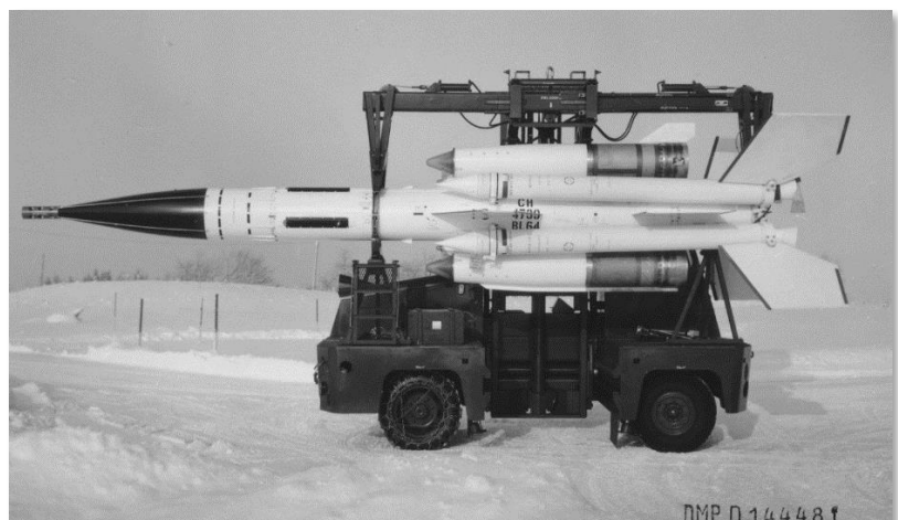
Ladefahrzeuge mit Lenkwaffe BL-64