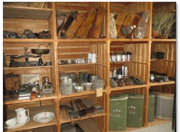
Persönliche Ausrüstung Aff bis Schanzknochen und Achselpatten 48 bis 79, persönliche Ausrüstung und Uniformzeichen verbinden die Erinnerungen der Zuger Milizen und das Zeughaus.