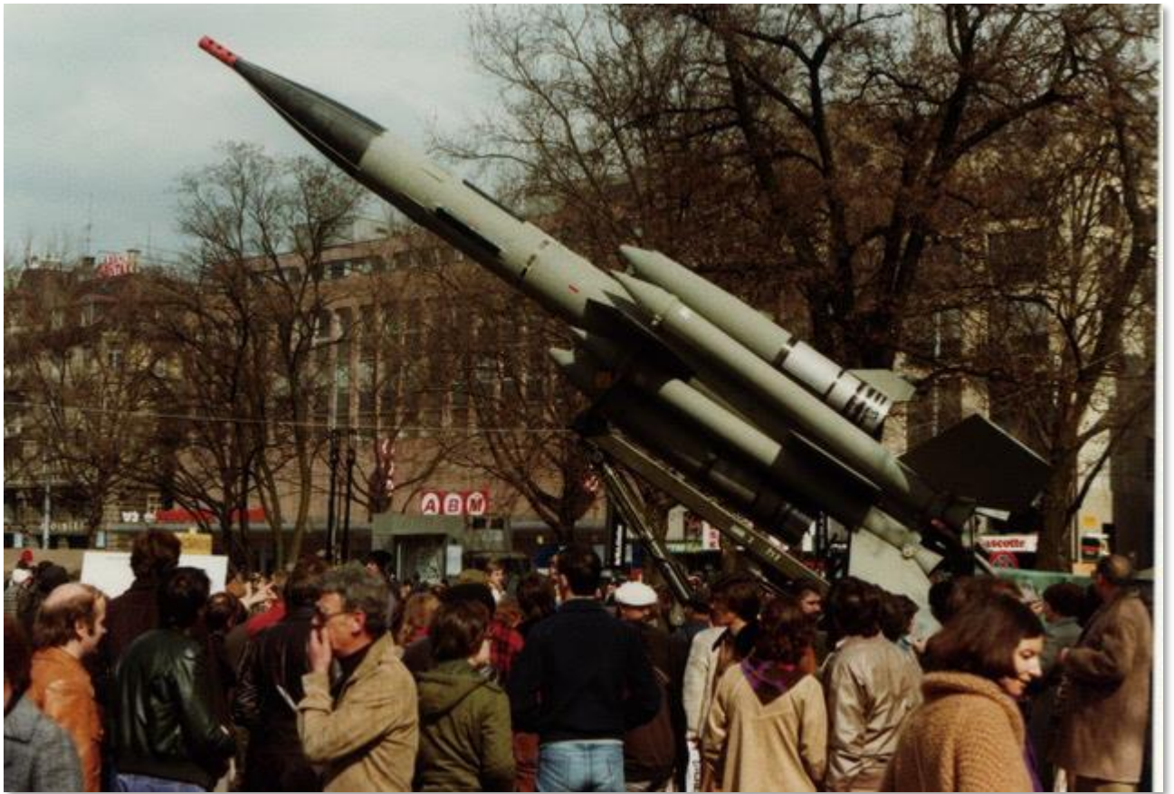
Rückschau 1979: BL-64 an der Wehrschau Z 79 auf dem Sechseläutenplatz in Zürich